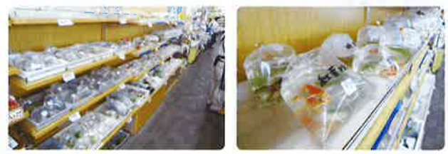
羽生市で育てられた金魚やメダカなどのコーナーも充実しております。