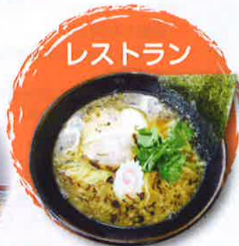
焦がしネギの香るスープが絶品の和風ラーメン